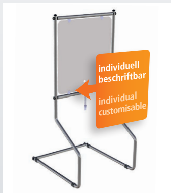
+ ESTACIÓN DE APARCAMIENTO