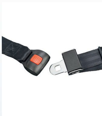
+ CINTURÓN DE SEGURIDAD