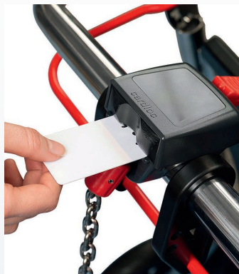
+ SISTEMA DE DEPÓSITO DE "KEY CARD"