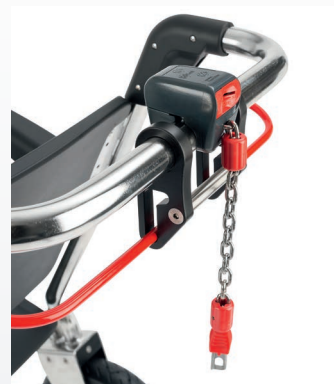
+ SISTEMA DE DEPÓSITO DE MONEDAS