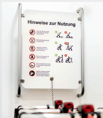
+ ESTACIÓN DE APAR- CAMIENTO MURAL