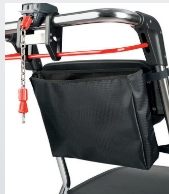
+ BOLSA MULTI- PROPÓSITO