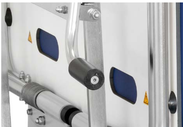
Acabado de gran calidad