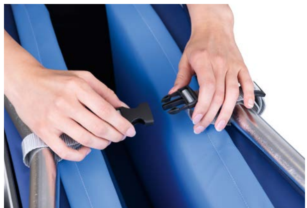
Alta exigencia de seguridad mediante el cierre de clic tras el plegado.